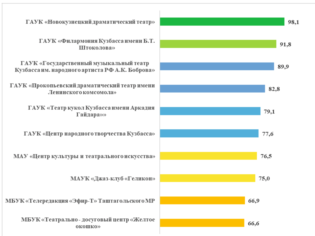
Рисунок 3 – рейтинг организаций театрально-зрелищного типа